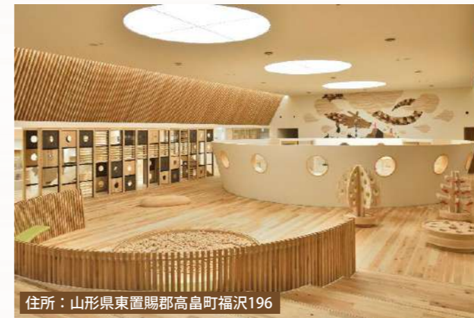
住所：山形県東置賜郡高島町福沢196

2019年7月にオープンした比較的新しい子育て支援施設です。東置賜郡高島町にあり、旧中学校体育館を改築して完成されました。館内は高島産の木材を使用していて、置かれているおもちゃは全て木製です。また、お子さんの年齢によって部屋を分けているため、事故が起きる危険も少なく安心して遊べます！天候を気にせずに体を動かして遊ぶには、もってこいの施設です。