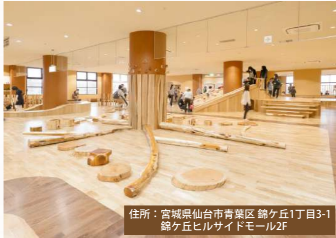
住所：宮城県仙台市青葉区 錦ヶ丘1丁目3-1 錦ヶ丘ヒルサイドモール2F

宮城県仙台市の錦ヶ丘ヒルサイドモールに構える、木を基調とした遊び場です！自然から遠ざかってしまった子どもたちに向けて、豊かな感性を育むために誕生しました。施設としては、9つの樹種から作られた30万個の木玉の湖や木の積み木、絵本コーナーなどが充実しています。そのため、大人が先回りして既成概念を押し付けず、子どもの好奇心を引き立てて自由にのびのびと遊べる場所になっています。