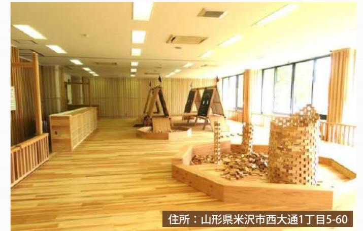
住所：山形県米沢市西大通1丁目5-60

山形県米沢市にある室内施設です。木のおもちゃや大型の木製遊具、さらには積み木の広場などがあるため、木のぬくもりや香りを全身で感じることができます！授乳スペース、オムツ替えスペース、駐車場が完備されているため足を運びやすいのも魅力です！0歳から就学前のお子さんと保護者の方が利用できます。