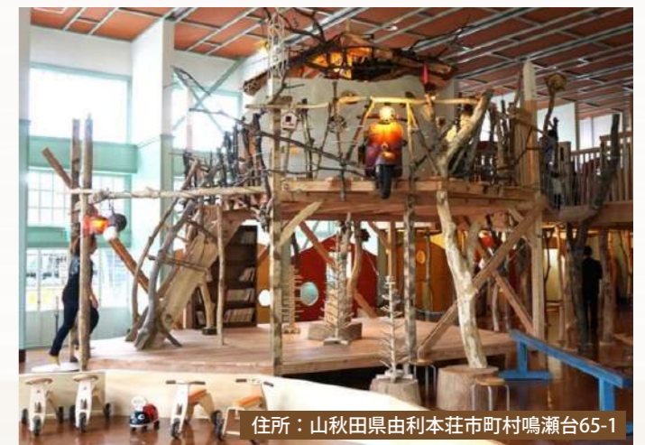
住所：山秋田県由利本荘市町村鳴瀬台65-1

廃校になった小学校をリノベーションして作られた、沢山の木のおもちゃと触れ合える美術館です！このモットーは地産地消。建物の内装や家具、そのほぼ全てが秋田県の由利本荘市内にある木材から作られています。また、おもちゃ学芸員という方がいらっしゃるのも、おもちゃ作り体験や昔ながらのおもちゃ体験など様々なワークショップが開催されていて、家族全員で楽しめます！ただし、上履きやスリッパが必須となるのでご注意ください！