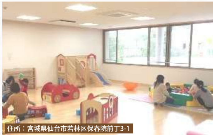
住所：宮城県仙台市若林区保春院前丁3-1