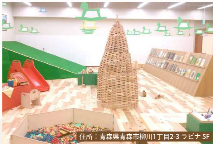
住所：青森県青森市柳川1丁目2-3 ラビナ 5F

青森県JR青森駅の駅ビルLOVINAの5階にある屋内の遊び場です！屋内施設であるため、天候を気にせずいつでも遊ぶことができる上に、駅からも近くアクセスが抜群です。施設の中は木のぬくもりを感じるために裸足で遊ぶことができ、青森県産の木材でできたおもちゃが沢山置いてあります。安心安全な木のおもちゃに囲まれながら、木のぬくもりに包まれてみては？